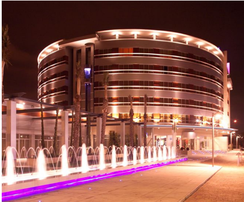
Hotel Abades Nevada Palace **** Calle de La Sultana, 3 18008 Granada